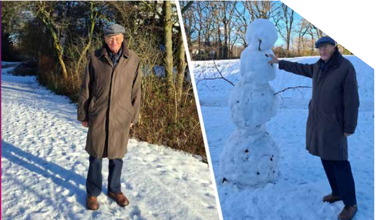
Sneeuwpret is voor iedereen!